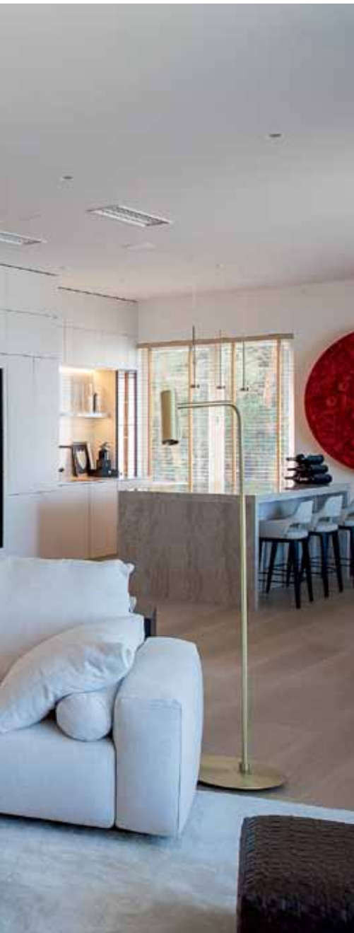
Roberto kodusid iseloomustavad avarus, suured aknad ja naturaalne valgus.